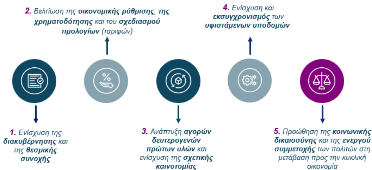
Εικόνα 2 Προτεραιότητες της ΡΑΑΕΥ για την Κυκλική οικονομία

Εμβαθύνοντας στις βασικές προτεραιότητες που προαναφέρθηκαν, το κείμενο αναλύει τα κρίσιμα ζητήματα που καθορίζουν την ευθυγράμμιση των στόχων της ΕΕ με τις εθνικές προσεγγίσεις, υποστηρίζοντας με ουσιαστικό τρόπο την προώθηση της Κυκλικής Οικονομίας.