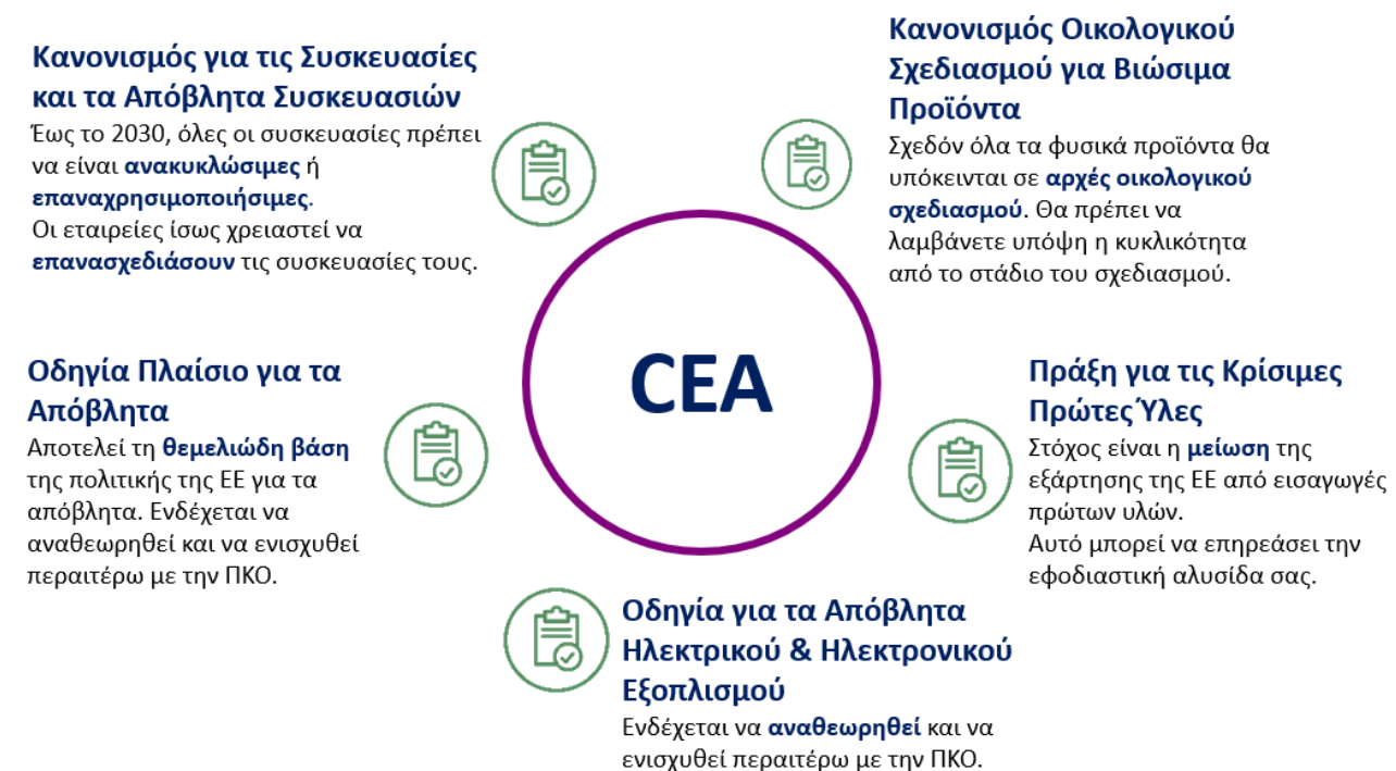
Εικόνα 1: Ευρύτερο ρυθμιστικό πλαίσιο για την κυκλική οικονομία

Η CEA δεν λειτουργεί απομονωμένα, αλλά αποτελεί μέρος ενός ευρύτερου ρυθμιστικού πλαισίου .